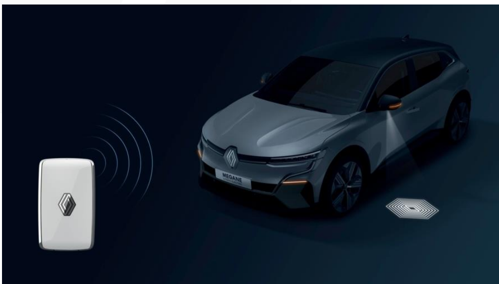
Kada se vlasnik kartice „Slobodne ruke“ približi vozilu, novi Megane E-TECH Electric pozdravlja ga svetlosnim efektom dobrodošlice.

Približavanje korisnika vozilu popraćeno je efektima dobrodošlice, skrivene ručice vrata, inače stopljene sa karoserijom, odjednom iskaču, a poklopac priključka za punjenje automatski se otključava.