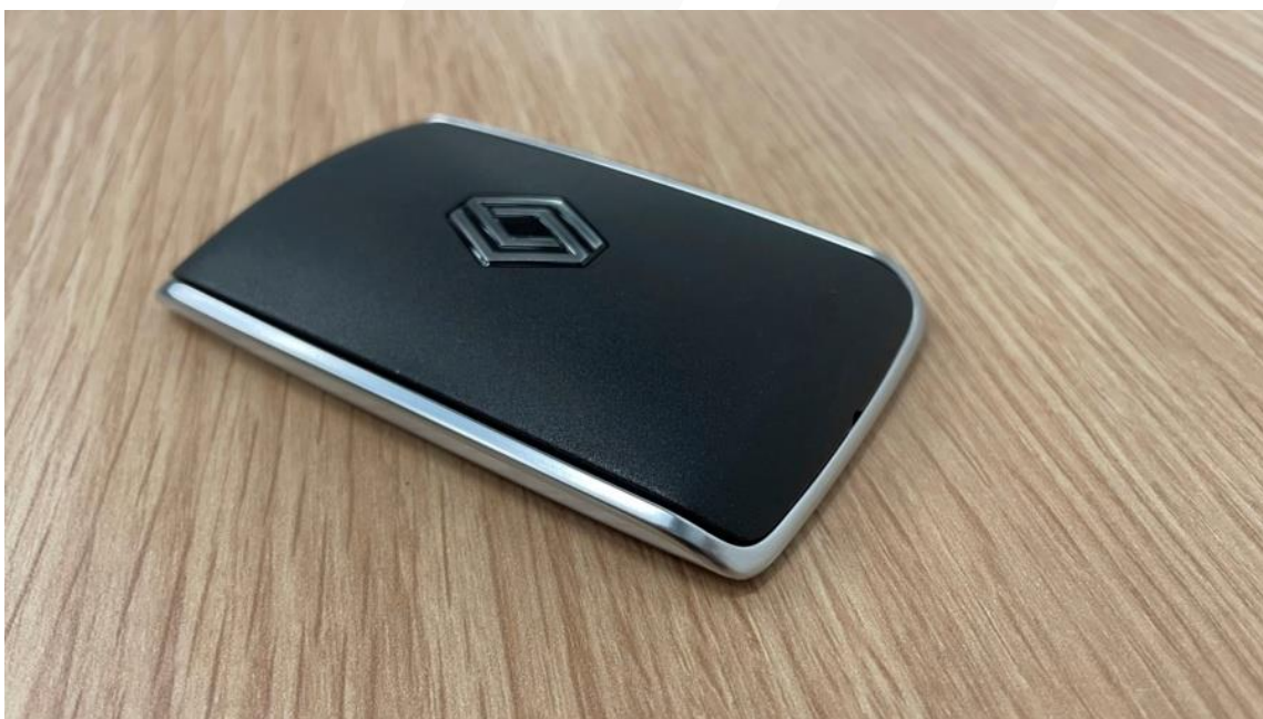
Primer najnovije kartice „Slobodne ruke” za novi Mégane E-TECH Electric.

Budući da bi pametni telefoni uskoro mogli da zamene kartice, Renault je odlučio da iskoristi sve što one pružaju i da im ne dopusti da odu u zaborav. Šta više, ovogodišnji podaci o porudžbinama Renaultove dodatne opreme pokazuju da kupci itekako cene kartice za upravljanje slobodnih ruku. Gotovo svaki drugi od tri prodana Renaultova vozila poručena su sa karticom „Slobodne ruke”. Neki modeli, kao što su ZOE i Espace, su u 100 % slučajeva naručivani zajedno sa karticom, dok su neki drugi, kao što su Scenic, Captur, Kadjar, Talisman, Koleos i Megane Conquest, naručeni sa karticom u više od 90 % slučajeva.