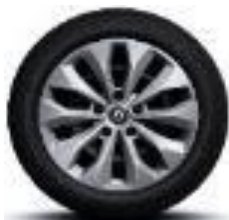
Čelični naplatci 16" sa ukrasnim poklopcima točkova Florida

S = Serija O = Opcija - = Nije dostupno P = Paket