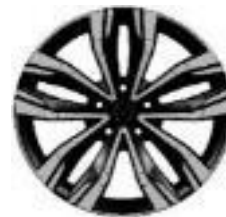
Aluminijumski naplatci 18" Hightek