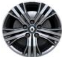
Aluminijumski naplatci 16" Siva Impulse