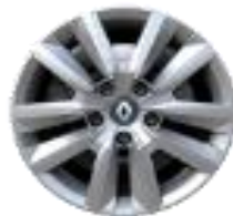
Ukrasni poklopci točkova Flexwheel 16"