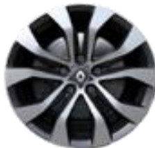
Aluminijumski naplatci 17" Allium