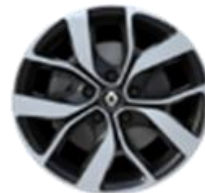
Aluminijumski naplatci 16" Celsius Silver