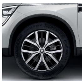
Aluminijumski naplatci 19" Proteus