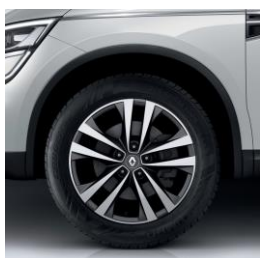
Aluminijumski naplatci 18" Argonaute