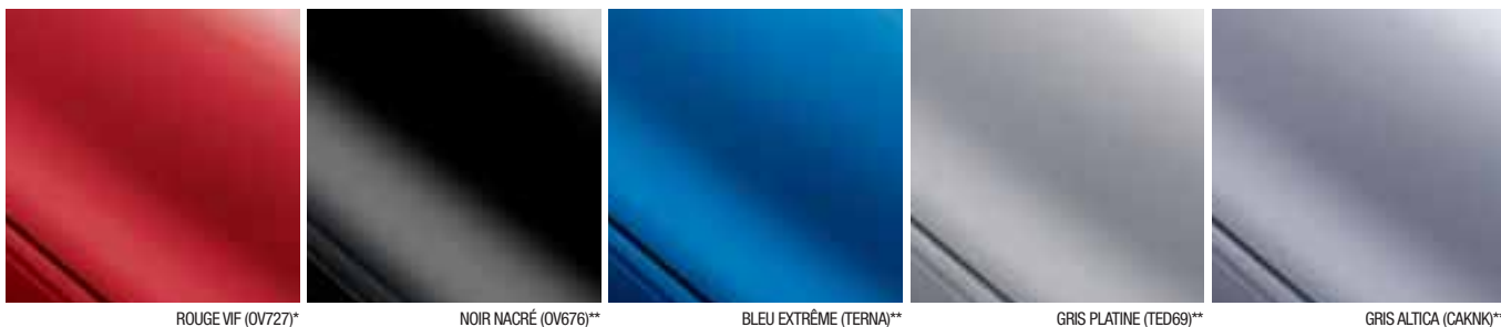
ROUGE VIF (OV727)*