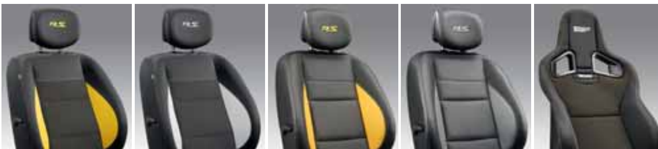
PRESVLAKE OD TKANINE U KOMBINACIJI SA ŽUTOM BOJOM (opcija)