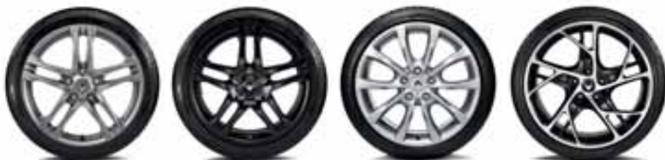
18" ALUMINIJUMSKI NAPLATCI AX-L SJAJNI HROM