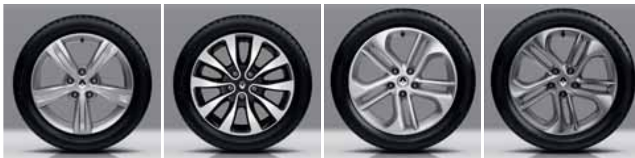
NAPLATAK SARI 17"