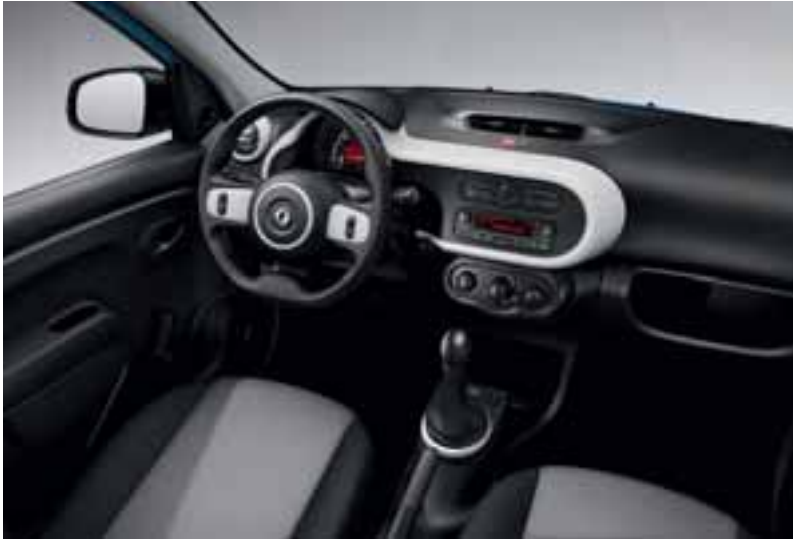
Na slici je prikazana opciona oprema.