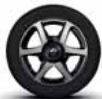
Aluminijumski naplatci 15" Argos