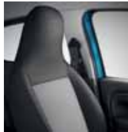
Crne presvlake Kario Elfa