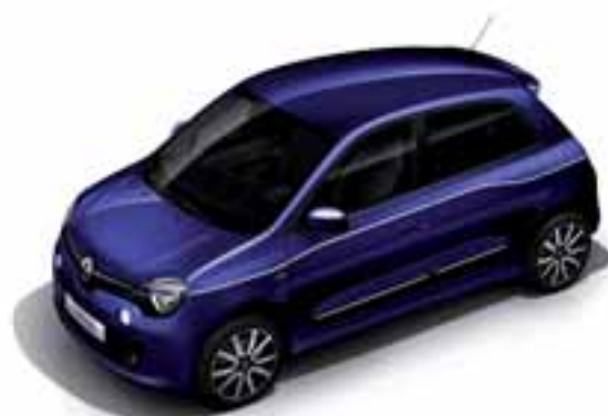
Ultra ljubičasta (TELNF)

NB: nemetalik boja; NP: nemetalik posebna boja; MB: metalik boja; MP: metalik posebna boja