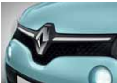
Prednja ukrasna lajsna u beloj boji

Paketi u posebnim bojama obuhvataju prednju ukrasnu lajsnu, zaštitne bočne ukrasne lajsne i kućišta spoljašnjih ogledala.