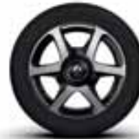
Aluminijski naplatci 15" Argos