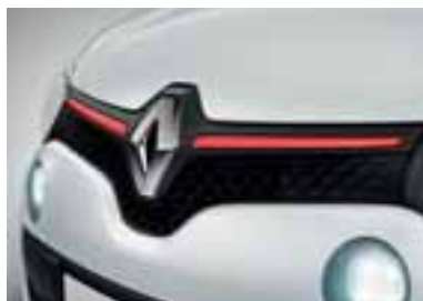
Prednja ukrasna lajsna u crvenoj boji