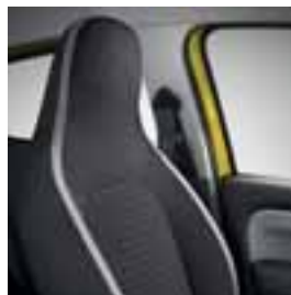
Sive Java Natte presvlake