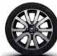
Aluminijumski naplatci 16" Embleme