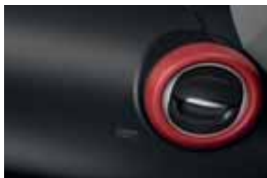
Okvir ventilacionih otvora u crvenoj Flamme boji