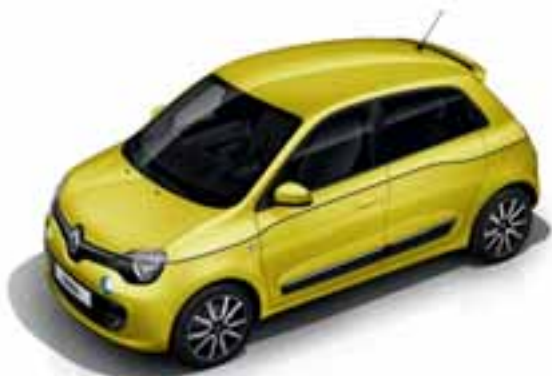
Žuta Eclair (NP ENW)