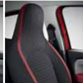
Crvene Java Natte presvlake