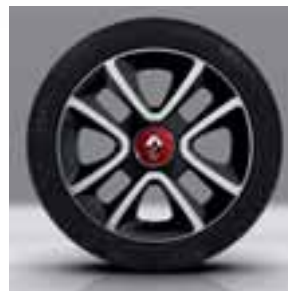
Specijalni aluminijumski naplatci 16" Juvaquatре