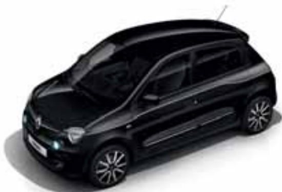
Crna Etoile (MB GNE)