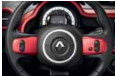
Umeci na upravljaču u crvenoj Flamme boji