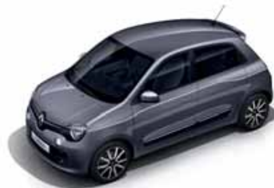
Siva Cosmic (MB KPE)