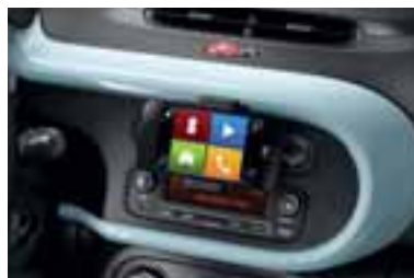
Okvir centralne konzole u plavoj Pill boji