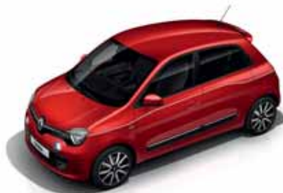
Crvena Flamme (MP NNP)