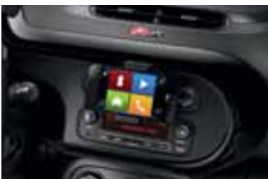
Okvir centralne konzole u crnoj boji