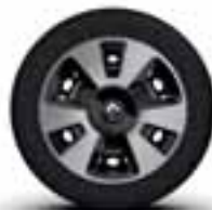
Veliki ukrasni poklopci 15" u srebrno - crnoj boji