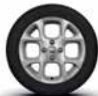
Aluminijumski naplatci 15" Exception