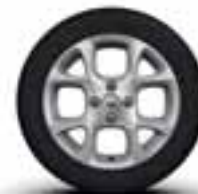
Aluminijumski naplatci 15" Exception