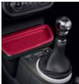
Sportska ručica menjača