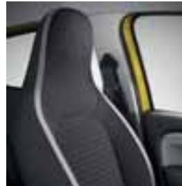
Sive Java Natte presvlake