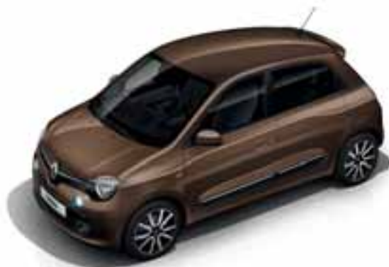
Braon Cappuccino (MB CNL)