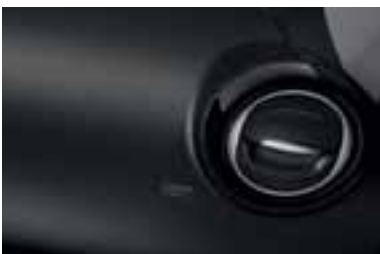
Okvir ventilacionih otvora u crnoj boji