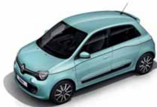
Plava Pill (NP RPP)