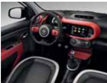
Unutrašnji ukrasni elementi u crvenoj boji