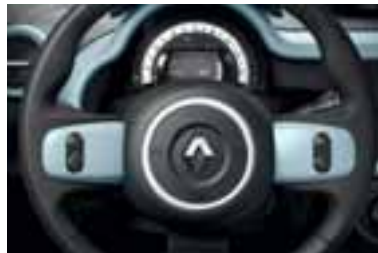
Umeci na upravljaču u plavoj Pill boji