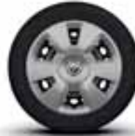
Veliki ukrasni poklopci točkova u srebrnoj boji 15"