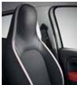
Presvlake u kombinaciji crne kože i tkanine sa belim umecima i crvenim rubom