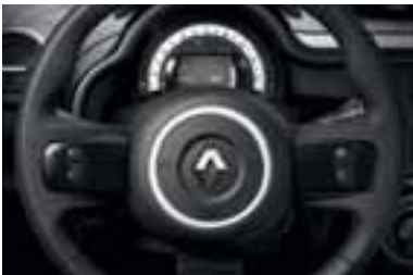
Umeci na upravljaču u crnoj boji

Svako unutrašnje uređenje obuhvata upravljač, kao i okvir centralne konzole i okvir ventilacionih otvora.