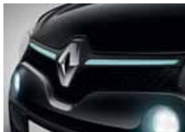
Prednja ukrasna lajsna u plavoj boji