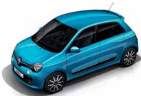
Plava Pacifique (MB RPM)