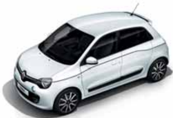
Bela Cristal (NB QNJ)