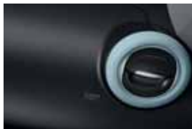
Okvir ventilacionih otvora u plavoj Pill boji