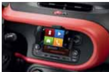
Okvir centralne konzole u crvenoj Flamme boji