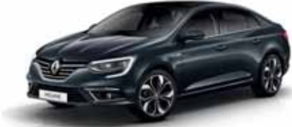
Siva Titanium (MB)