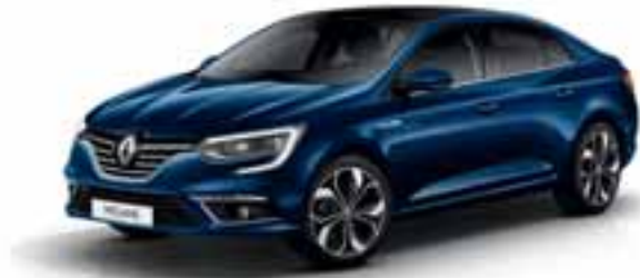
Plava Cosmos (MB)