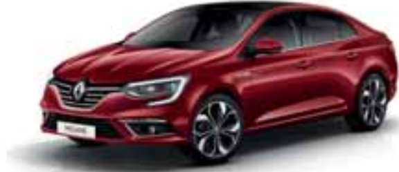
Crvena Intens (MB-P)