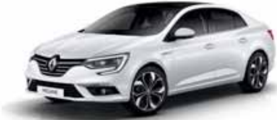
Ledeno bela (JB)