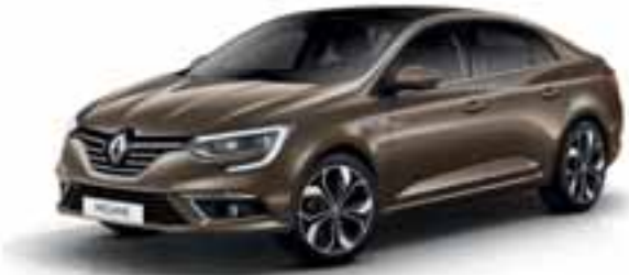
Braon Vison (MB)