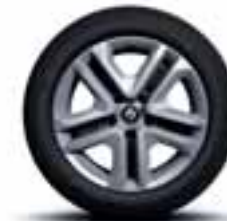
Čelični naplatci 16" sa ukrasnim poklopcima točkova Complea