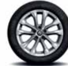
Aluminijski naplatci 17" Exception (Opcioni naplatci)