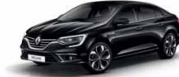
Crna Etoile (MB)