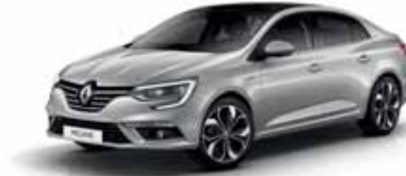
Siva Platine (MB)