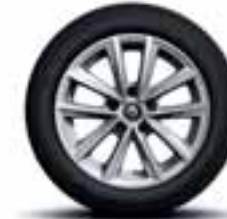
Aluminijski naplatci 16" Silverline