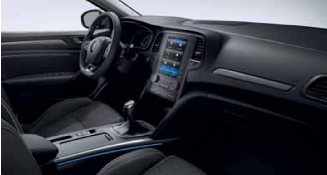
Slika prikazuje opcionu opremu.