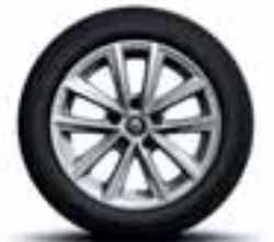
Aluminijumski naplatci 16" Silverline (Opcioni naplatci)