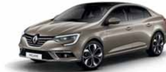
Bež Dune (MB)

JB: jednoslojna boja MB: metalik boja MB-P: metalik boja - posebna Slike su simbolične i nisu obavezujuće.