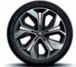
Aluminijski naplatci 18" Grandtour (Opcioni naplatci)