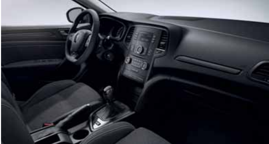
Slika je simbolična.