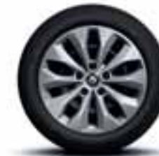
Čelični naplatci 16" sa ukrasnim poklopcima točkova Florida