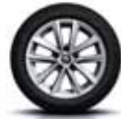
Aluminijumski naplatci 16" Silverline