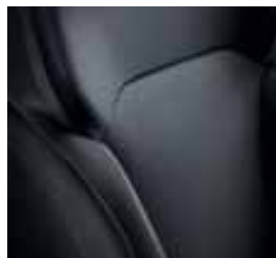
Tamna tkanina (neutralni šavovi)