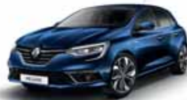
Plava Cosmos (SEC)***