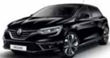
Crna Etoile (SEC)