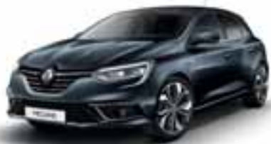
Siva Titanium (SEC)