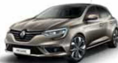
Bež Dune (SEC)***