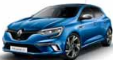
Plava Iron (SEC)*

SEC: metalik boja. CO: jednoslojna boja. Fotografi je su simbolične.