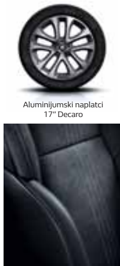
Aluminijumski naplatci 17" Decaro