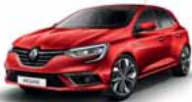
Crvena Flamme (SEC)*