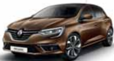
Braon Kapućino (SEC)**