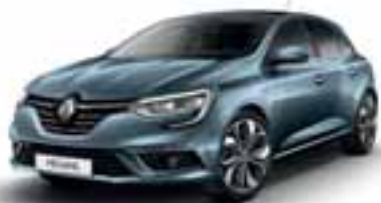
Plava Berlin (SEC)