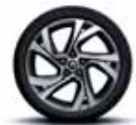
Aluminijumski naplatci 18" Magny-Cours