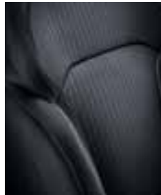
Tamna tkanina (kontrastni šavovi)