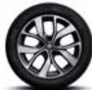
Aluminijumski naplatci 17" Celsius