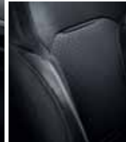
Tamna tkanina u kombinaciji sa imitacijom kože