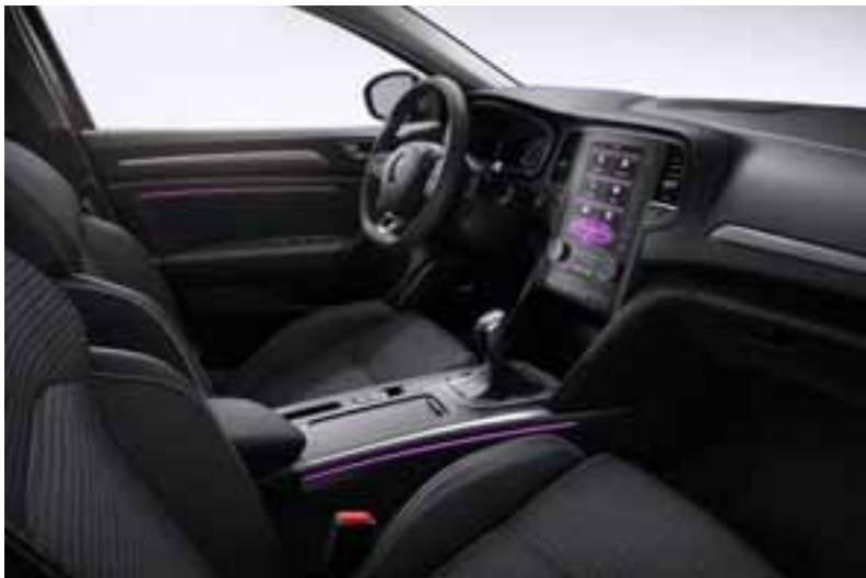
Slika prikazuje opcionu opremu.