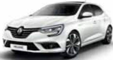
Perla bela (SEC)*