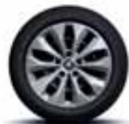
Čelični naplatak 16" sa ukrasnim poklopcem Florida