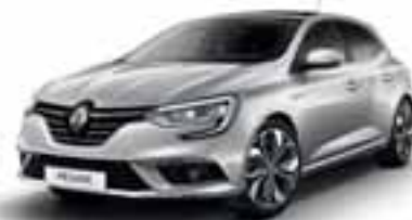
Platinasto siva (SEC)