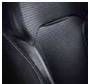
Tamna tkanina BOSE® u kombinaciji sa imitacijom kože