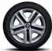
Čelični naplatci 16" Flexwheel sa ukrasnim poklopcima Complea