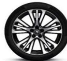
Aluminijumski naplatci 19" Initiale Paris