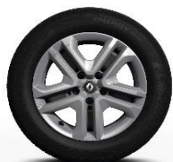
Čelični naplatci Flexwheel 16" sa ukrasnim poklopcima Complea

S = Serija O = Opcija - = nije dostupno * Dostupno u paketu