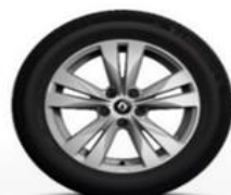
Aluminijumski naplatci 17" Bayadere