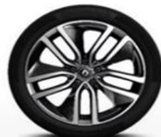
Aluminijumski naplatci 19" Alizarine *