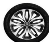
Aluminijumski naplatci 18" Duetto