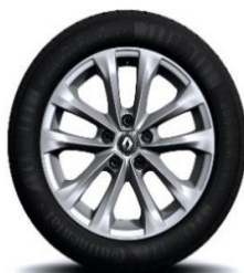
Aluminijumski naplatci 17" Exception