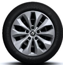
Čelični naplatci 16" sa ukrasnim poklopcima naplatka Florida