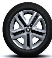
Čelični naplatci Flexwheel 16" sa ukrasnim poklopcima naplatka Complea