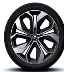
Aluminijumski naplatci 18" Grandtour