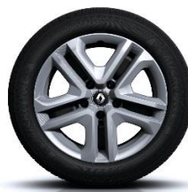
Čelični naplatci Flexwheel 16" sa ukrasnim poklopcima naplatka Complea