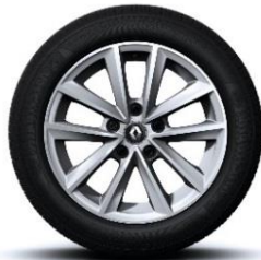
Aluminijumski naplatci 16" Silverline