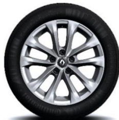
Aluminijumski naplatci 17" Exception