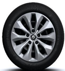
Čelični naplatci 16" sa ukrasnim poklopcima naplatka Florida