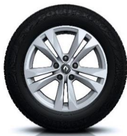
Aluminijumski naplatci 17" Esqis