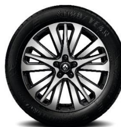
Aluminijumski naplatci 19" Initiale Paris