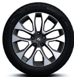
Aluminijumski naplatci 19" Proteus