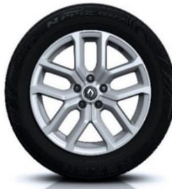
Aluminijumski naplatci 18" Taranis