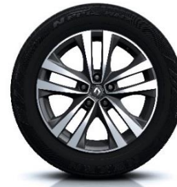
Aluminijumski naplatci 18" Argonaute