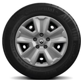
Čelični naplatci 16" sa ukrasnim poklopcima točka Pragma