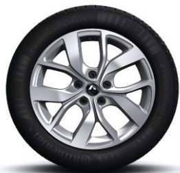
Aluminijumski naplatci 17" Celsius