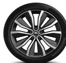
Aluminijumski naplatci 19" Egeus