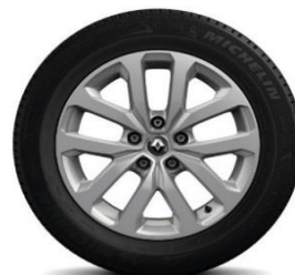
Aluminijumski naplatci 17" Aquila