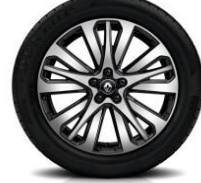
Aluminijumski naplatci 19" Initiale Paris