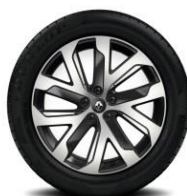
Aluminijumski naplatci 19" Quartz