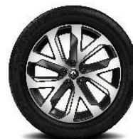
Aluminijumski naplatci 19" Quartz Črna