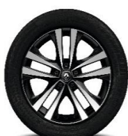
Aluminijumski naplatci 18" Argonaute