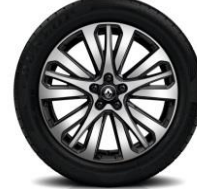
Aluminijumski naplatci 19" Initiale Paris