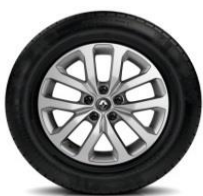
Aluminijumski naplatci 17" Aquilai

S = Serija O = Opcija P = u paketu - = nije dostupno