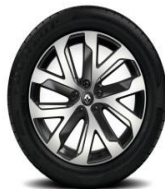
Aluminijumski naplatci 19" Quartz