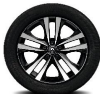
Aluminijumski naplatci 18" Argonaute