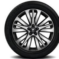
Aluminijumski naplatci 19" Initiale Paris