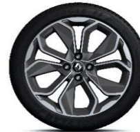
Aluminijumski naplatci 17" Optemic - Hrom i siva