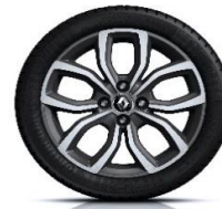
Aluminijumski naplatci 16" Pullsize - Siva