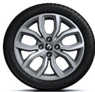
Aluminijumski naplatci 16" Pulsiz - Hrom