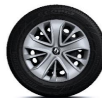
15" ukrasni poklopci Lagoon