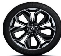
Aluminijumski naplatci 17" Optemic - Hrom i crna