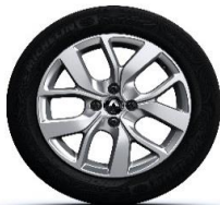
Aluminijumski naplatci 16" Celsius