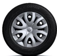
15" ukrasni poklopci Paradise