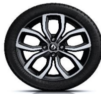
Aluminijumski naplatci 16" Pullsize - Crna