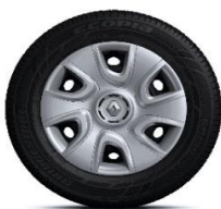
15" ukrasni poklopci Extreme